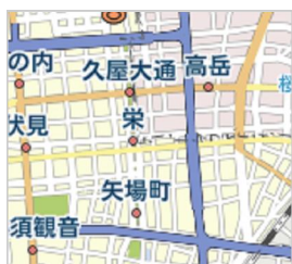
愛知県名古屋市中区