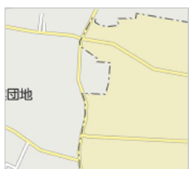
山形県酒田市宮内新開発