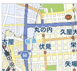
愛知県名古屋市中区錦1丁目...